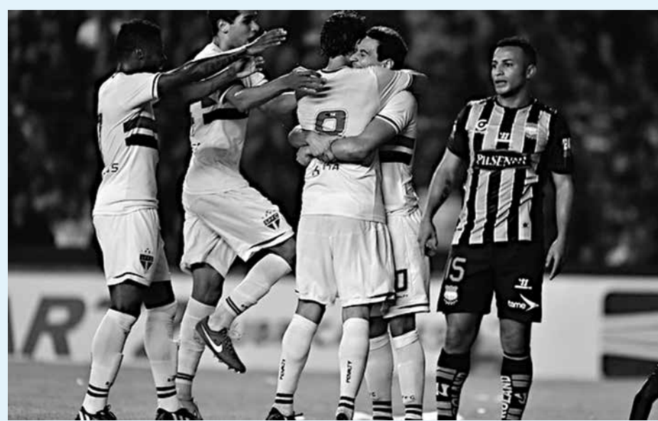
Equipe brasileira perdeu jogo para o Emelec, mas conseguiu passar para próxima fase

“Começou assim mesmo, com um gol que não era esperado. De-