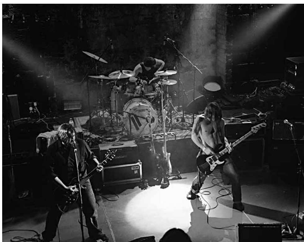
Banda alemã Samavayo está em turnê pelo Brasil e toca na capital