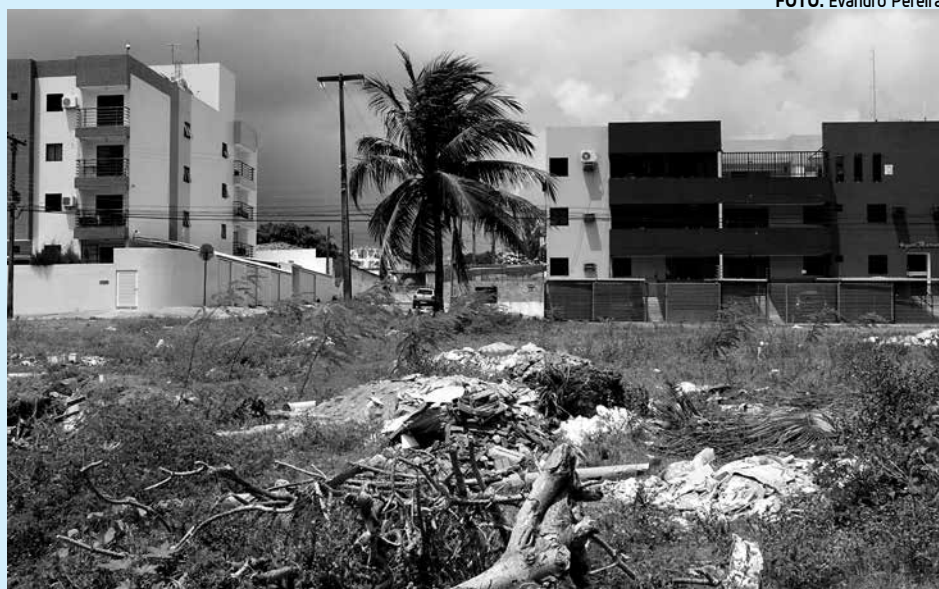
A autuação para o dono do terreno com lixo é de 400 UFIRs, algo em torno de R$ 11 mil

A Prefeitura Municipal de João Pessoa (PMJP), por meio da Autarquia Especial Municipal de Limpeza Urbana (Emlur), iniciou, ontem, uma operação de fiscalização em obras de construção, reforma e demolição na capital. Cinco equipes iniciaram os trabalhos no bairro do Bessa. A operação está sendo feita em função do grande número de descarte clandestino de resíduos da construção civil em vários pontos da cidade.