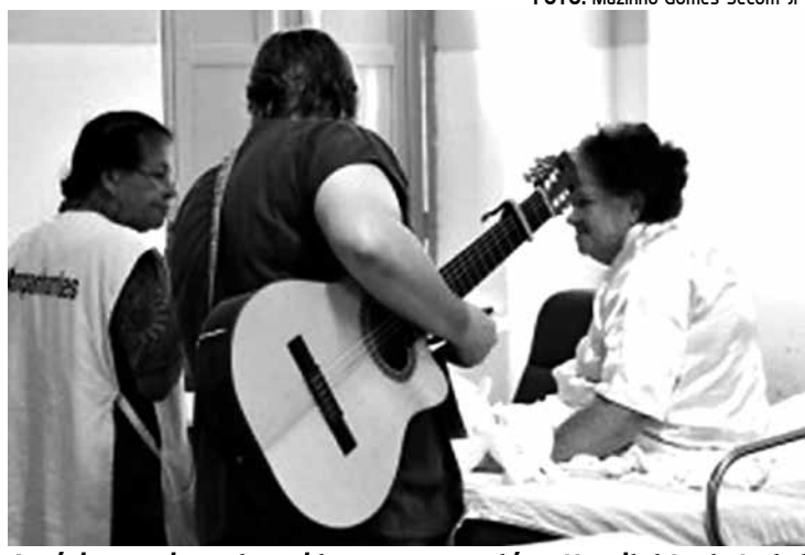
A música reanima e traz vida para quem está no Hospital Santa Isabel