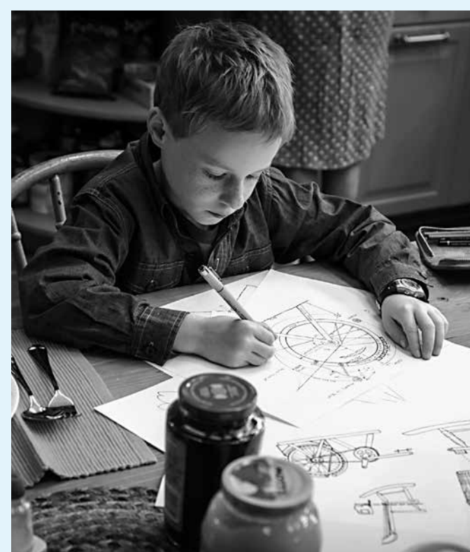
Obra traz garoto apaixonado por cartografia