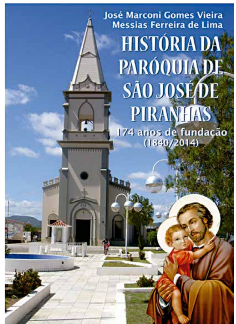
Capa da obra sobre a religiosidade em São José de Piranhas

A paróquia que é capa do livro, completa no dia 10 de novembro,