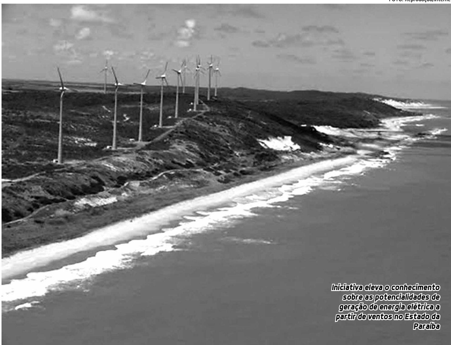
Iniciativa eleva o conhecimento sobre as potencialidades de geração de energia elétrica a partir de ventos no Estado da Paraíba

Estudo permite investimento na geração de energia elétrica renovável na Paraíba