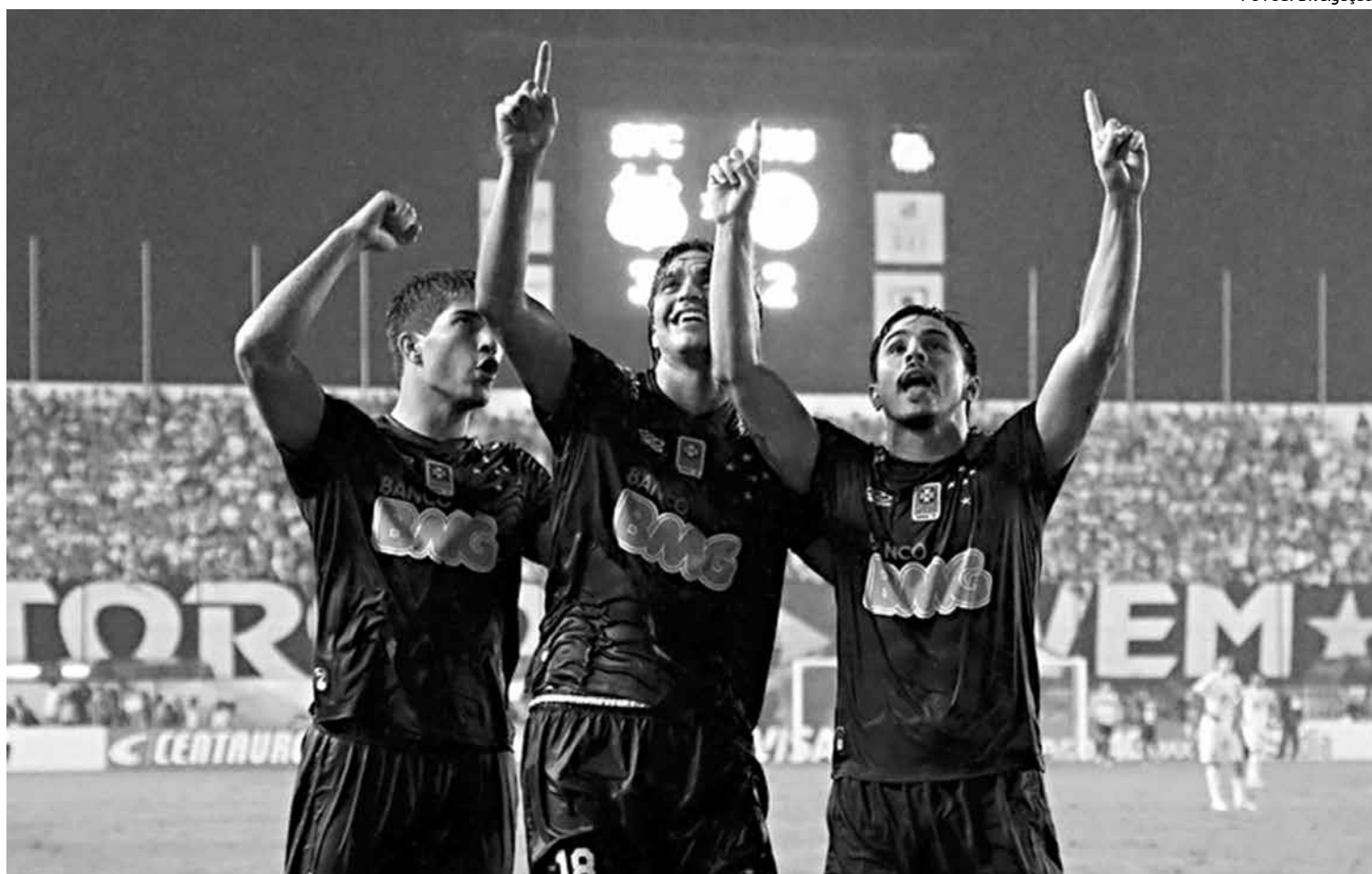
Além da vantagem, o Cruzeiro empatou na Vila Belmiro com o Santos (3 a 3) e conseguiu vaga histórica para a final da Copa do Brasil

O presidente do Galo revelou ainda que a comissão técnica e os jogadores vão ter influência na decisão da escolha do local onde o time vai mandar a final da competição contra a Raposa. “Quando nós levamos o jogo do Corinthians para o Mineirão foi um pedido dos jogadores”, disse, acrescentando que “também pode escolher onde jogar é uma vantagem para o Galo”.