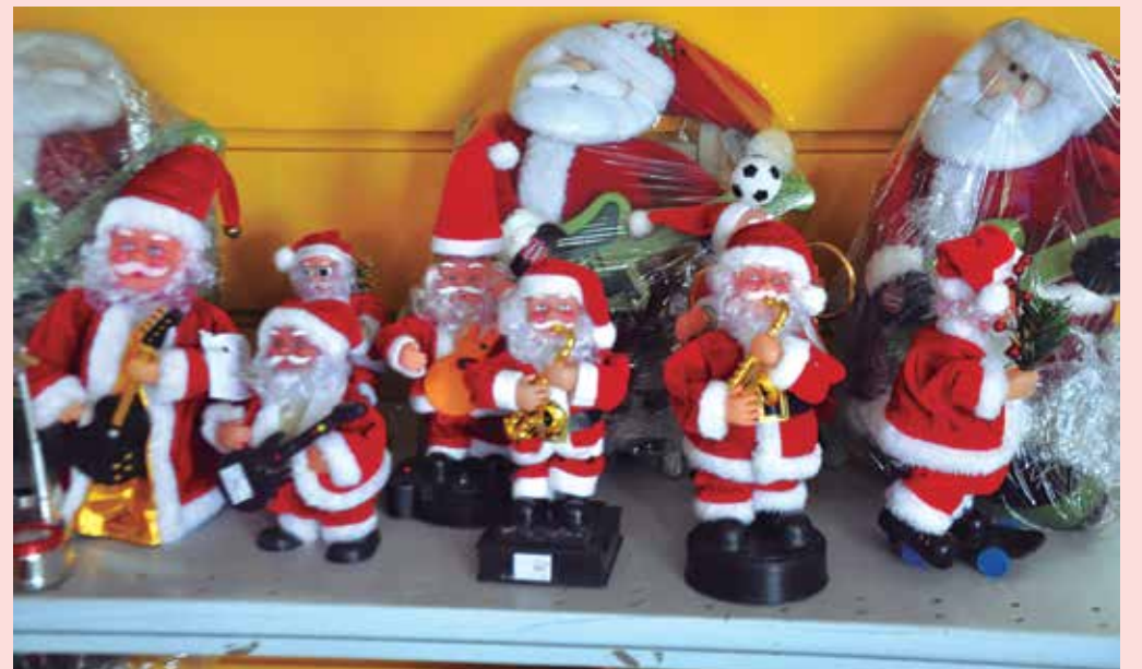
Produtos natalinos que estiverem à venda e fora dos padrões serão recolhidos

Durante as fiscalizações que o órgão vai realizar a partir deste mês, os produtos que estiverem fora dos padrões serão recolhidos e os comerciantes autuados com multas que variam de acordo com a situação da empresa.