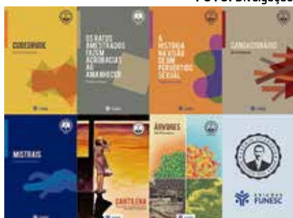
Coleção valoriza criação estadual