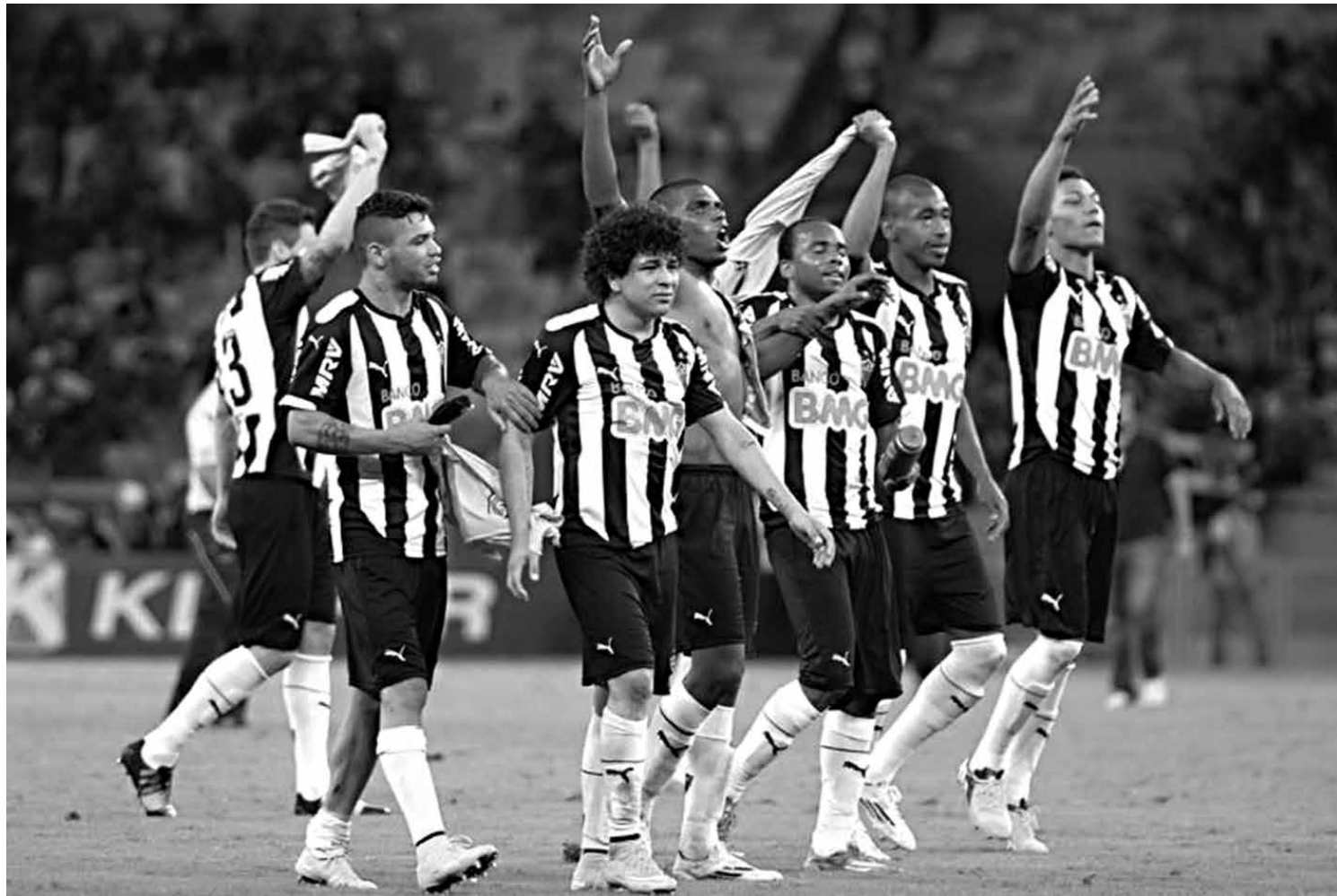
Acreditando na superação, após perder jogo de ida por 2 a 0, Atlético não reconheceu o Flamengo e aplicou uma goleada de 4 a 1